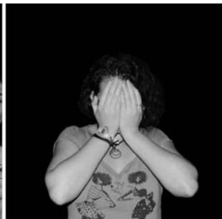
Já o tom takhle nepřemejšlim...