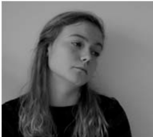
Pohádka, písnička, mlhoš...