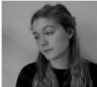
Čerti, štětka, parohy...