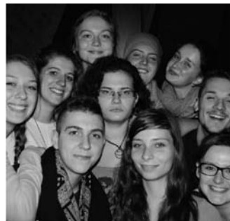
Don't you want somebody to love...?